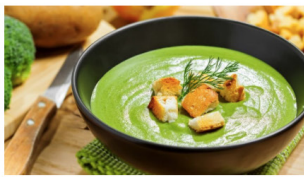
Potet- og brokkolisuppe

Skriv for eksempel 'grønnsaker', 'tomat', 'fisk' eller 'kjøtt'