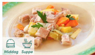
Betasuppe med pinnekjøtt