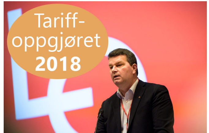
LO-leder Hans-Christian Gabrielsen LO ønsker at lønnsoppgjøret 2018 blir et samordnet oppgjør. Her LO-leder Hans-Christian Gabrielsen på talerstolen under LOs representantskap.